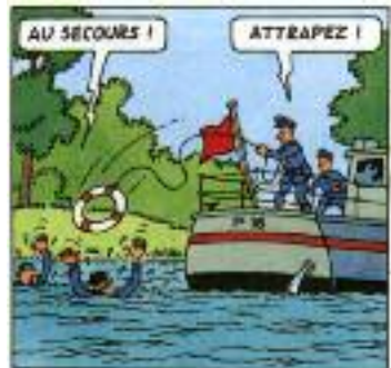
Bob de Moor. "Les aventures de Johan et Stephan", 1989. Editions Rijperman.