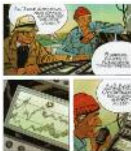
Dominique Sérafini. "L'Aventure de l'Equipe Cousteau en BD. Le Mystère de l'Atlantide", 1988. Editions Robert Laffont.