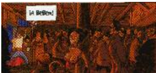
Alfred, Jean Phillippe Deygraud. "La desesperación del mono", 2006. Rossell.

Selecció de missatges i vinyetes per a la conferència inaugural de la facultat de Nàutica de Barcelona del curs 2007-2008.