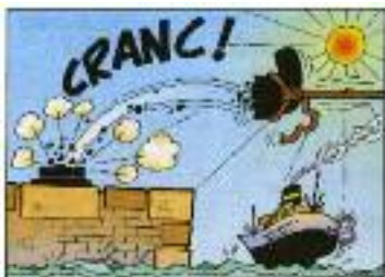
Francisco Ibáñez. "Las aventuras de Mortadelo y Filemón", 1998. Ediciones B. Professionals preparats per saber fer Fer. "Revista", 2002. Editorial El Jueves Professionals íntegres com a individus