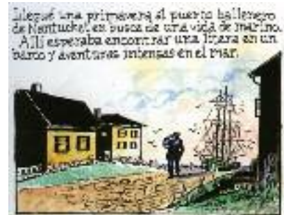
Will Eisner. "Moby Dick", 1996. Norma Editorial.