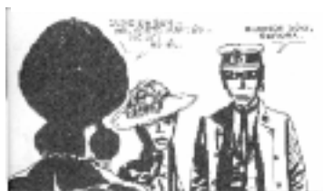
Hugo Pratt. Corto Maltés. 1982. Editorial Toutain.