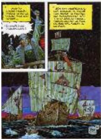
Antonio Hernández Palacios. "Relatos del Nuevo Mundo. El Primer Viaje de Colón: Una Candela Lejana", 1992. Editorial Planeta-Agostini.