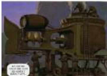
Vicente Segrelles. "El Mercenario, 1993". Ediciones B.