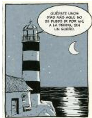
Paco Roca. "El faro", 2004. Editorial Astiberri

Un comportament segurament influenciat per les condicions en les quals es desenvolupa la seva activitat. No oblidem que la finalitat darrera d'un navegant és assegurar l'estabilitat del viatge i la consecució dels objectius, que són arribar a port, superar les permanents crisis de màquines o les tempestes i perills del mar. Aquest tipus de vida professional és més ric en aquestes exigències extremes que les feines normals que podem desenvolupar a terra, i influeix directament en el comportament peculiar de la gent de mar.