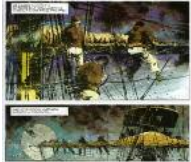
William Vance. "Bruce J. Hawker," 1986. Editions du Lombard.